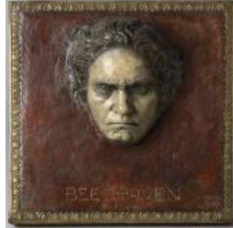
Ludwig van Beethoven (68183)