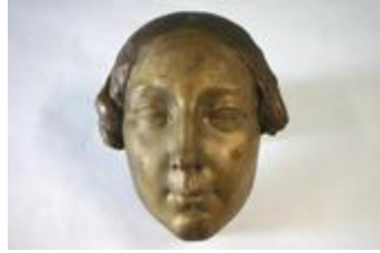
Masque de Yanthis : femme Renaissance (200269)