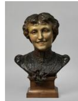
Sarah Bernhardt (201028)