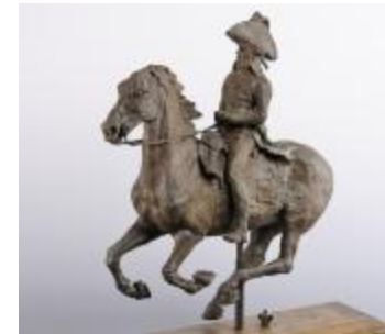
Le général Duroc à Castiglione (6852)