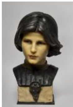
Jeune prince de la famille Médicis (201031)