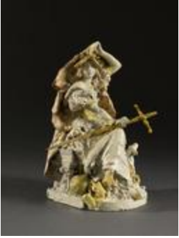
La France de la Renaissance (200911)