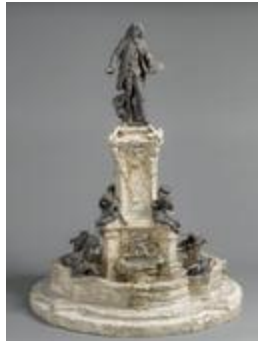
Fontaine de Watteau (15037)