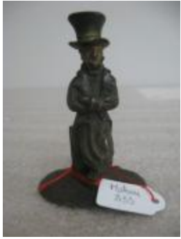
Homme en costume Louis-Philippe (?) (200275)