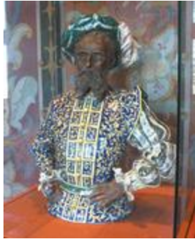
Portrait d'homme en costume Renaissance (200225)