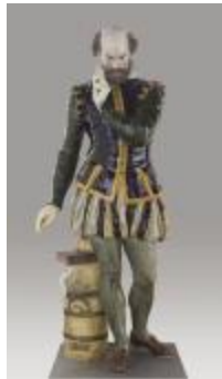
Bernard Palissy (200301)