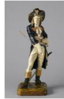
Le Conventionnel (200337)