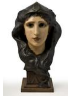
IXe Symphonie, dite Sarah Bernhardt (201029)