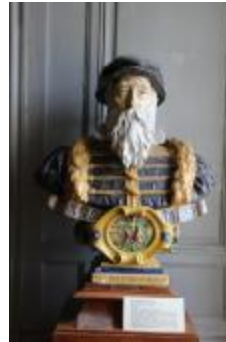
Bernard Palissy (200972)