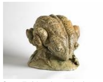
Grenouille faisant le gros dos (200777)