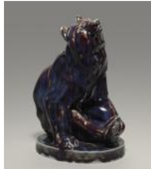
Ours mendiant (200959)