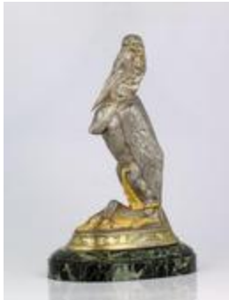
Marabout tenant un caïman dans ses pattes (200284)