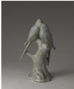
Les Perruches inséparables (200429)