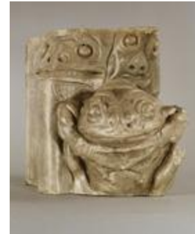
Grenouilles et têtes de monstres (200814)