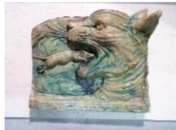
Souris se jetant dans la gueule d'un chat (200951)