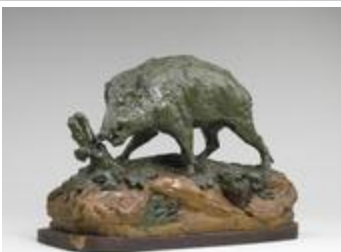
Maquette pour Le Sanglier (200263)