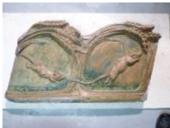
Souris dans les blés (200950)