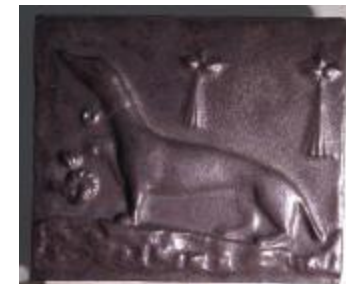
Élément de frise : chien (200942)