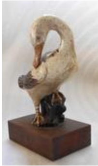
Canard lissant ses plumes (201052)