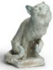
Chat assis (200649)