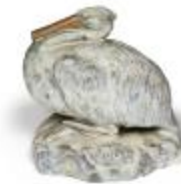
Pélican assis sur un rocher (200636)