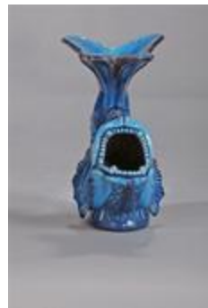
Poisson bleu (200234)