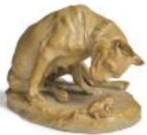
Le Chien à la grenouille (200690)