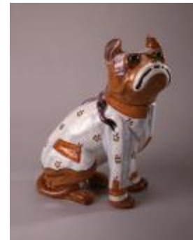
Chien assis (200503)