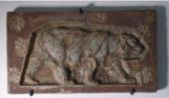
Elément de frise : ours (200944)