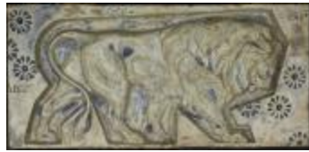
Lion passant (152915)