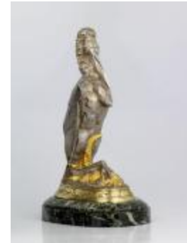
Marabout tenant un caïman dans ses pattes (200283)