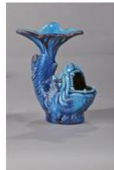
Poissons bleus (201092)