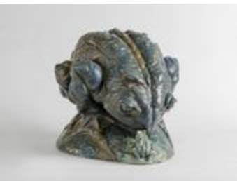
Crapaud et grenouille dit aussi Grenouille faisant le gros dos (200772)