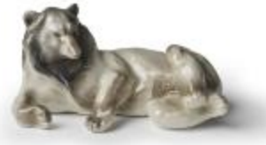
Ours du Tonkin (200662)