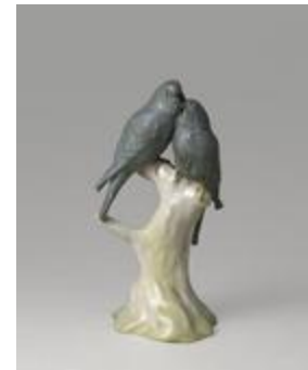
Les Perruches inséparables (201082)