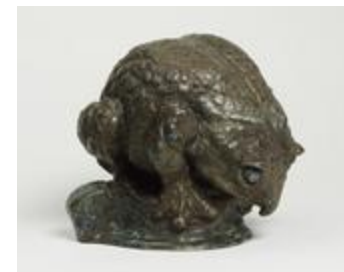
Petite grenouille, dite aussi Grenouille le dos courbé (200809)