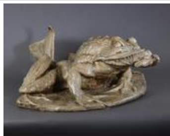
Animal fantastique (200756)