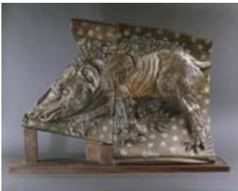
Le Sanglier (200831)