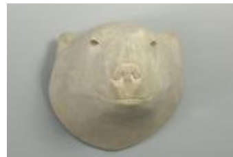
Ours blanc, tête monumentale (200963)