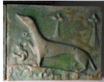
Elément de frise : chien (200946)