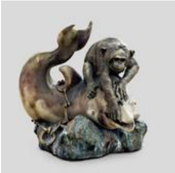
Le Conseil s'amuse, dit aussi Singe et dauphin (201033)