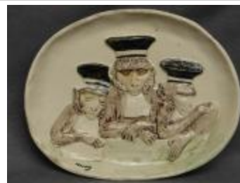
Tribunal des singes (200990)