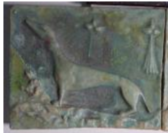
Elément de frise : chien (200945)