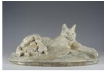
Chatte allaitant ses petits (200958)