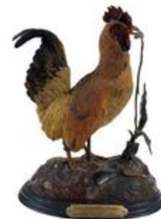
Le Coq et la perle (200213)