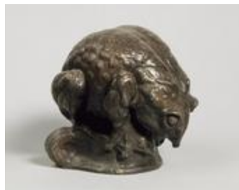
Petite grenouille, dite aussi Grenouille le dos courbé (200808)