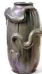
Vase au serpent (201022)