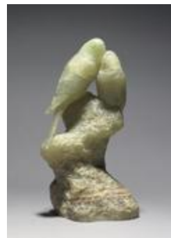
Les Perruches inséparables (3600)