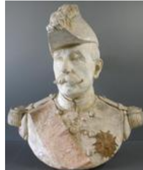
Général de division : Auguste Dubail (200271)