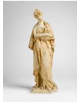
La Pensée sorbonnienne (200447)