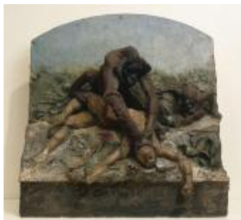
Orang-outang étranglant un sauvage de Bornéo (200285)