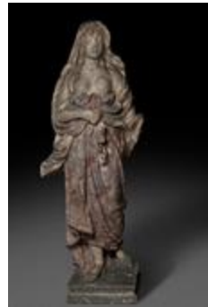
Femme voilée, le bon accueil (200445)