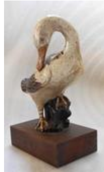
Canard lissant ses plumes (201052)