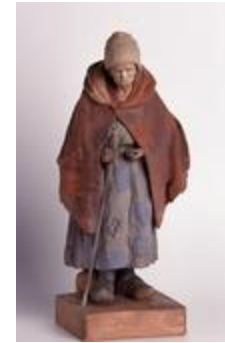
Vieille mendiante (200292)