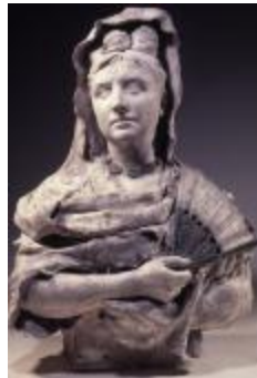
Madame Astruc en espagnole (200205)