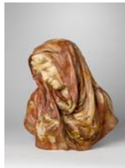
Buste de femme voilée souriant (200438)