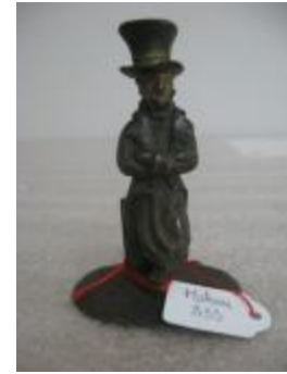
Homme en costume Louis-Philippe (?) (200275)