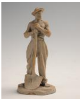
Le Terrassier, travailleur debout tenant une bêche (200925)