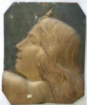
Tête de femme de profil, une étoile sur la tête (200270)