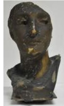
Femme voilée : symphonie en "la" de Beethoven (200244)