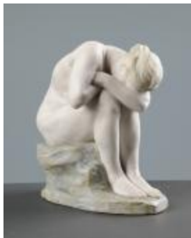
Miroir brisé ou La Vérité méconnue (200924)