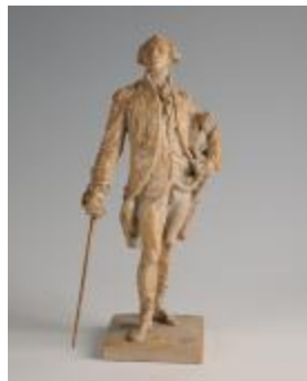
Le Général Lafayette (200923)