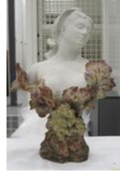
La Tourangelle (201043)