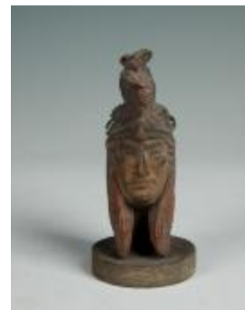
Tête de Lucien Guitry dans le rôle de Chantecler (200934)