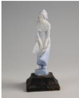
Petite paysanne (200927)