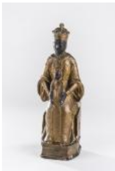
Vierge noire du Puy-en-Velay (200312)