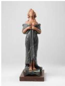
Femme drapée levant la tête (200441)