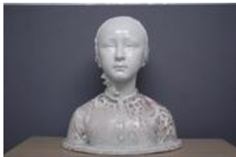
Petite fille (200240)