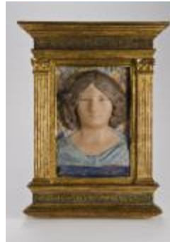
Tête de femme (200647)