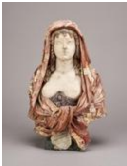
Buste de femme voilée (200440)