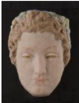
Masque de femme (200648)