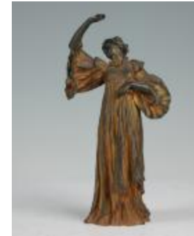
Danseuse à la marguerite (201081)