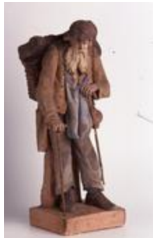
Vieux mendiant (200293)