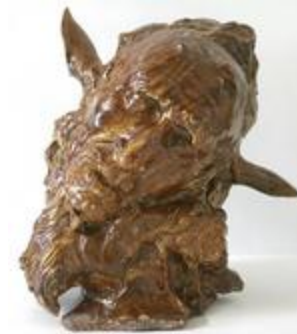
Tête de faune (200267)