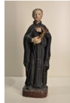
Portrait du Révérend Père Jean François Régis, jésuite (Saint François Régis) (200303)