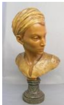
Anier arabe (200250)