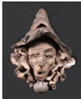
Vase - tête (201051)