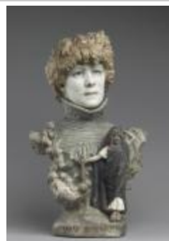
Sarah Bernhardt (15297)