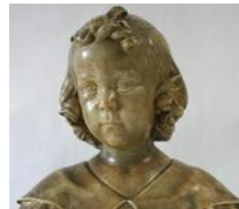
Buste de fillette (200268)