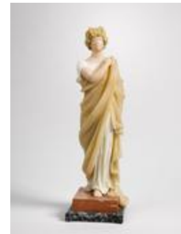
Femme drapée (200443)