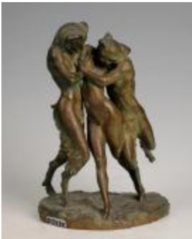
Nymphe et satyre (201078)