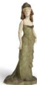
La Comtesse Récopé (200673)