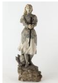
Jeanne d'Arc (200624)