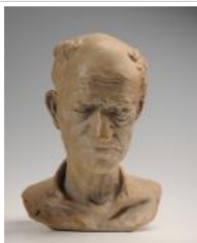
Tête de paysan (200926)