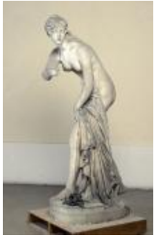
La Vestale (200404)