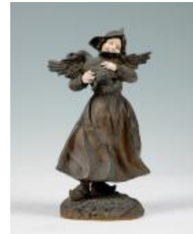
Jeune Hollandaise tenant une oie dans ses bras (200933)