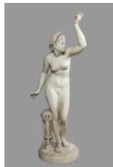
Prêtresse d'Eleusis (200526)