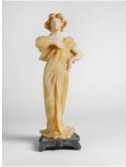
Femme drapée (200444)