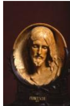
Tête de Christ (200203)