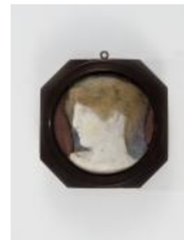
Profil de femme (200646)