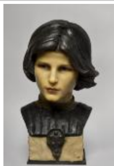
Jeune prince de la famille Médicis (201031)