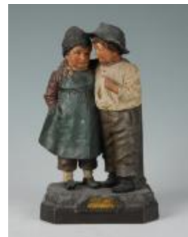
Les Deux Gosses (200932)