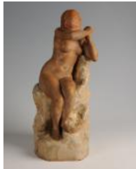
La Pudeur (201074)