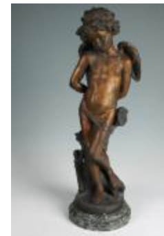
L'Amour vaincu (201080)