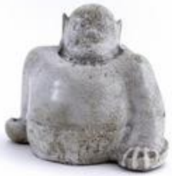
Buste grotesque (200835)