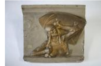
Allégorie de la Guerre : femme nue portant un bouclier (200272)