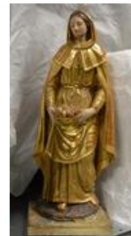
Sainte Elisabeth (200307)