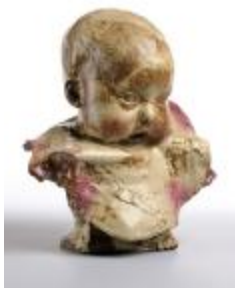
Bébé à la bouche ouverte (200403)