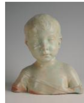
Bambino boudeur (200931)