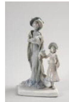
En promenade (200928)