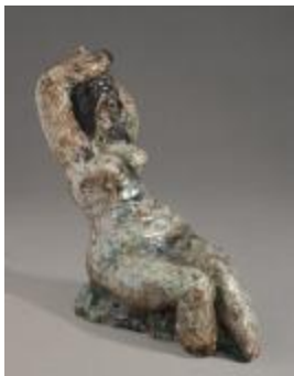
Femme nue (200299)