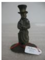
Homme en costume Louis-Philippe (?) (200275)