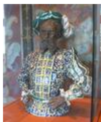
Portrait d'homme en costume Renaissance (200225)