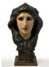
IXe Symphonie, dite Sarah Bernhardt (201029)