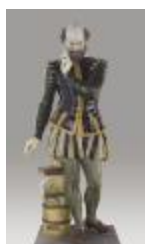
Bernard Palissy (200301)