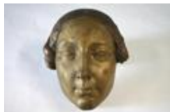
Masque de Yanthis : femme Renaissance (200269)