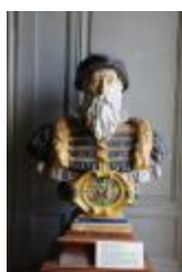
Bernard Palissy (200972)