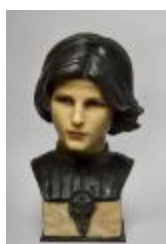
Jeune prince de la famille Médicis (201031)