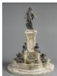
Fontaine de Watteau (15037)