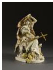
La France de la Renaissance (200911)