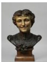
Sarah Bernhardt (201028)