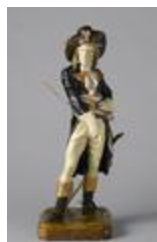
Le Conventionnel (200337)