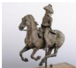
Le général Duroc à Castiglione (6852)