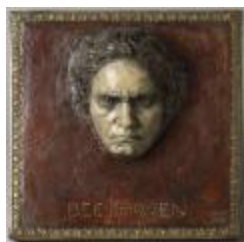
Ludwig van Beethoven (68183)