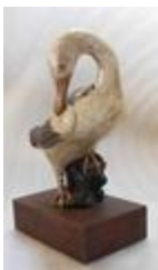
Canard lissant ses plumes (201052)