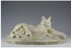
Chatte allaitant ses petits (200958)