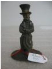
Homme en costume Louis-Philippe (?) (200275)