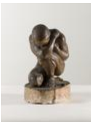
Homme agenouillé (200747)