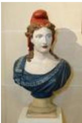
Buste de la République (200862)