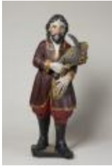
Saint Isidore (200527)