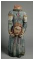
Sainte Solange (200245)