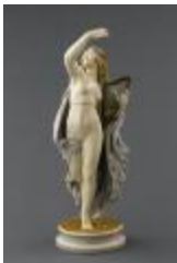
La Poésie légère (200340)